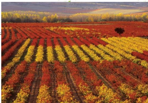
拉里奥哈葡萄酒产区风光