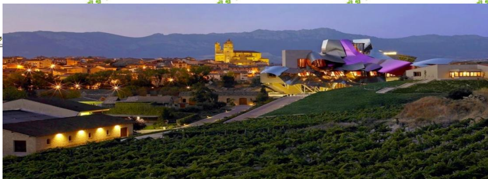
田园中的马凯思酒庄