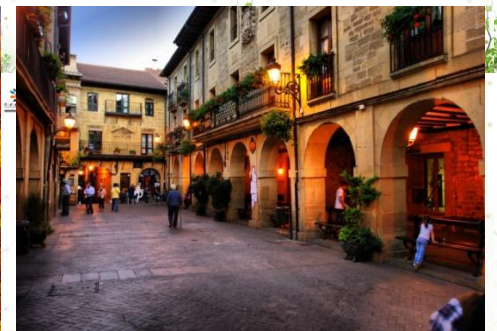
拉瓜尔迪亚中世纪古镇