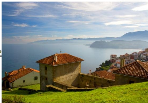
拉斯镇远处海岸线升起的水雾

早餐： 酒店早餐 午餐： 海鲜拼盘 晚餐： 古堡酒店晚餐 酒店： 桑镇古堡酒店 3 星