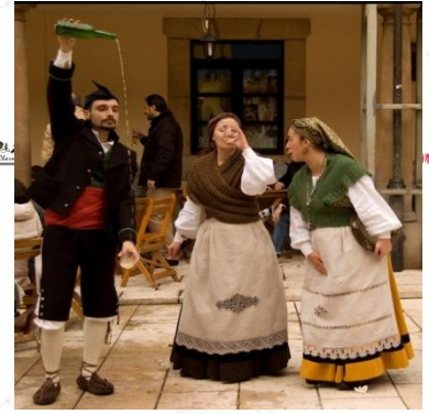
苹果酒没点技术可倒不到杯子里