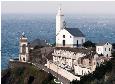
卢卡渔村尽头的海上教堂